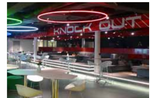
Het meubilair en het podium van het sportcafé