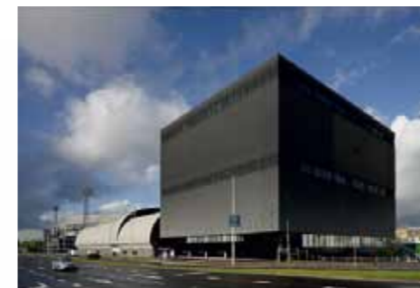
Het exterieur van het nieuwbouwgedeelte