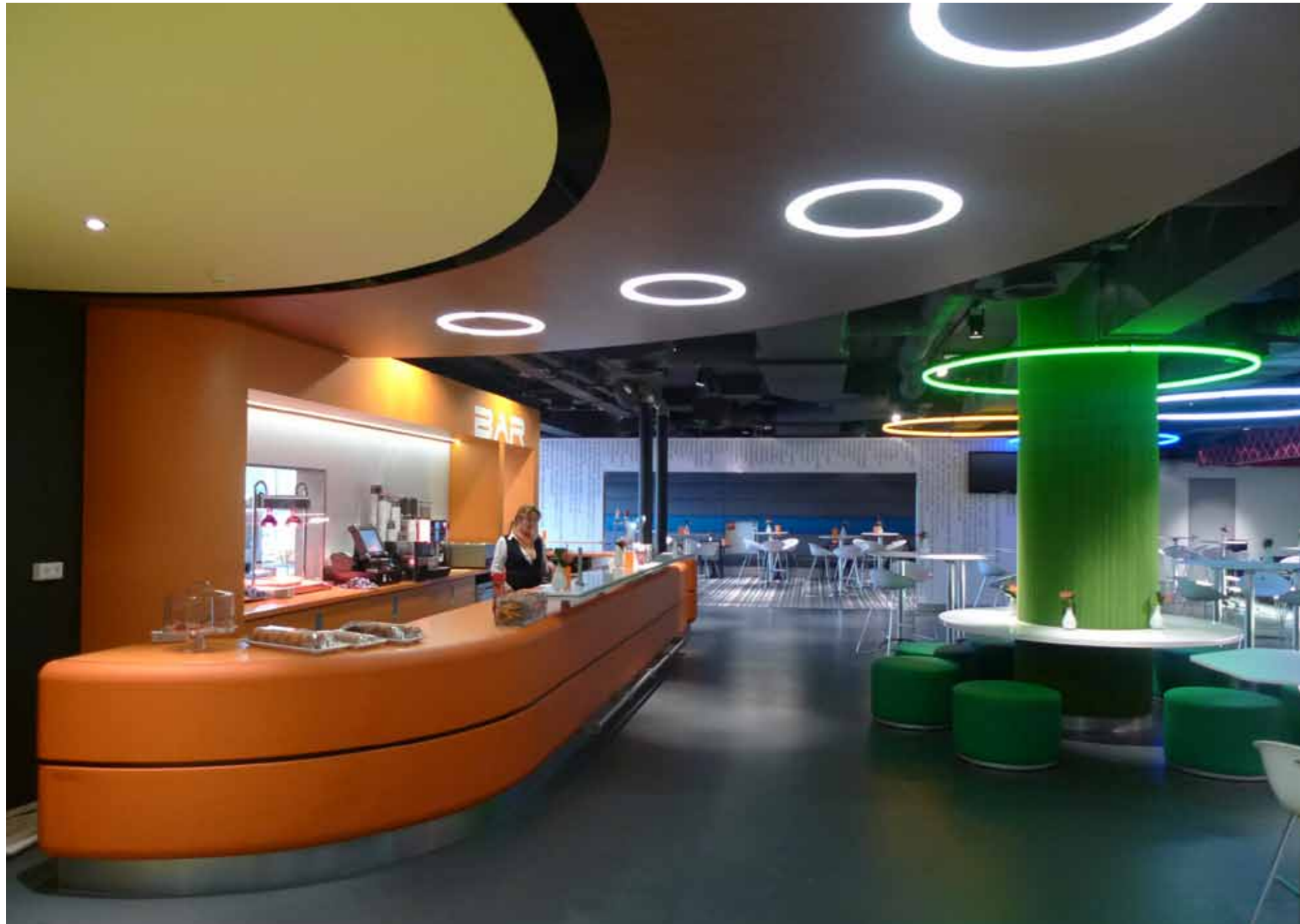
Het interieur van het sportcafé