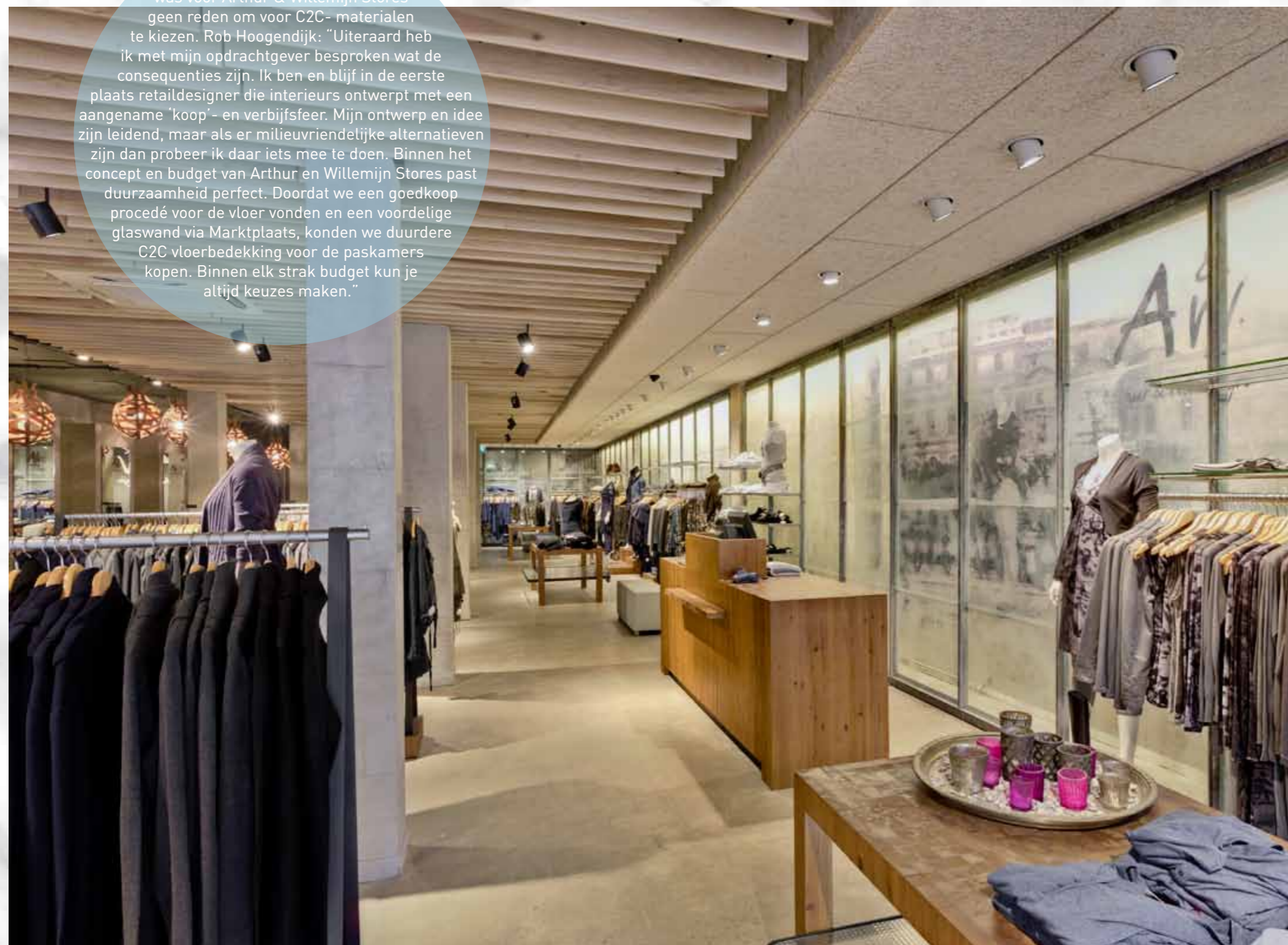
Interieur met de hergebruikte glaswand uit de kasbouw